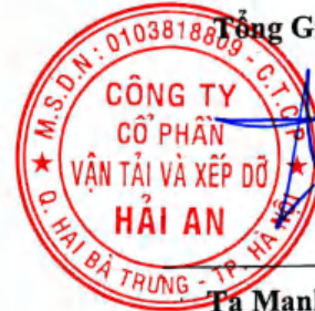
Tạ Mạnh Cường