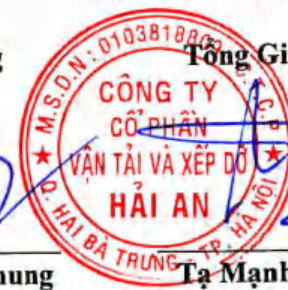
Tạ Mạnh Cường